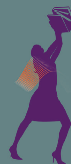
Mal à l'épaule