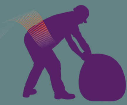
Mal au dos