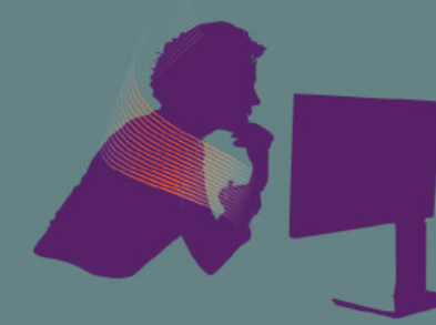
Mal au cou