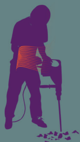
Mal au poignet