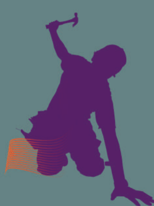
Mal au genou