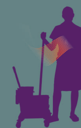
Mal au coude